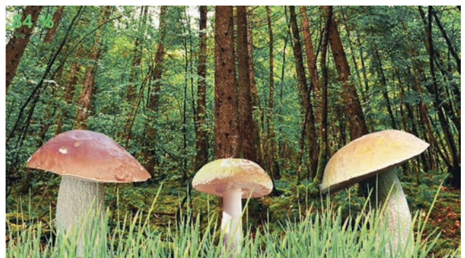
Рабочее окно пациента

В программе «Нейрон-Спектр.NET» разработаны тренинги, в которых предъявление разнообразного контента (картинки, фотографии, игры, фильмы, музыка) связано с параметрами физиологического сигнала. При этом специалист может выбрать один из предложенных вариантов обратной связи или даже использовать свой собственный.