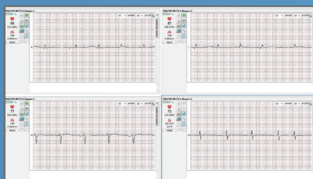
Окно миниатюр (тренировка 4 пациентов)