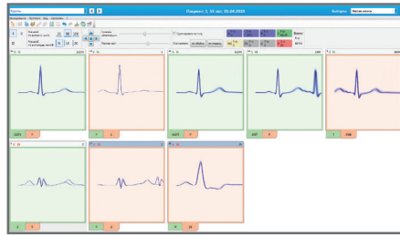
Работа с группами