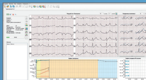
Окно полноэкранного режима