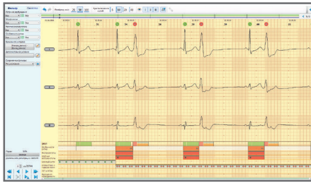
Лента ЭКГ с маркерами QRS и событий ритма